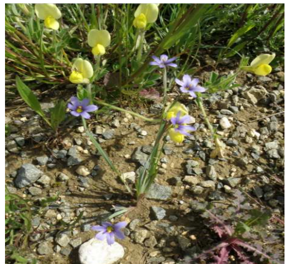
Bermudienne ( sisyrinchium montanum ) famille des iris Tétragonolobe siliquieux (jaune) famille des légumineuses