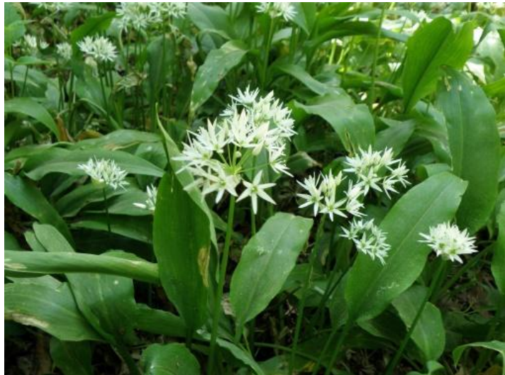
Ombelles de fleurs