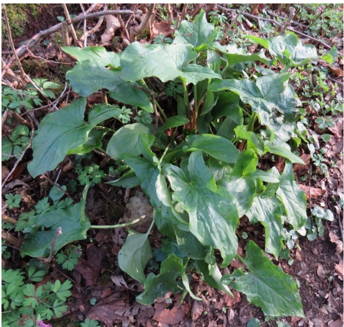
Arum tacheté et ses feuilles sagittées