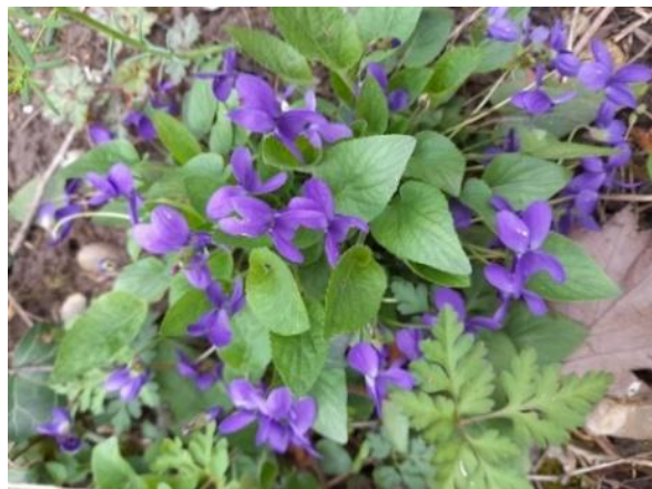
Violette des bois