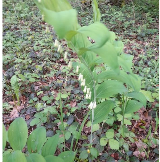
Sceau de Salomon (en fleurs)

C'est dans leur éperon que se trouve le nectar de la Corydale : éperon qui lui a valu son nom. Il vient du grec « Korydalis » qui signifie alouette huppée, l'éperon ressemblant à la petite huppe de l'alouette.