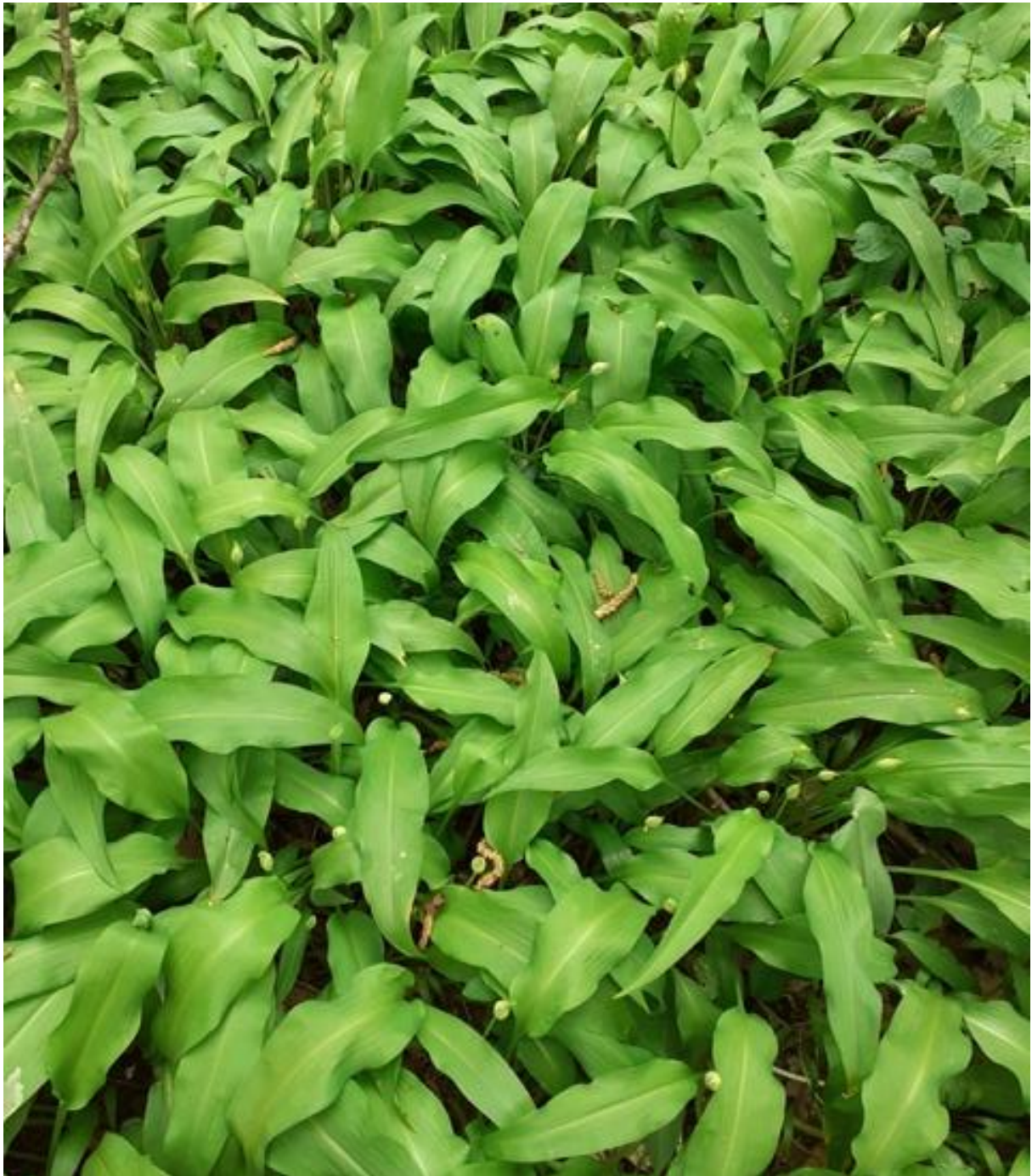
Tapis de feuilles d'ail des ours

La majorité de toutes ces plantes printanières ont une préférence pour les sols calcaires. Le calcaire oolithique de la Miotte leur permet de s'épanouir pleinement. Quand les feuilles des arbres couvriront la forêt, elles disparaîtront, faute de lumière, et réapparaîtront au prochain printemps !