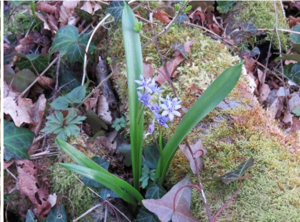
Scille à 2 feuilles (en fleurs)

La Scille à 2 feuilles a déclaré forfait : elle n'a plus de fleurs, déjà fanées. Seules ses feuilles à petit capuchon (dites cuculées) continuent à grandir.