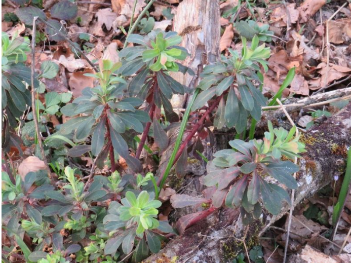
Euphorbe à feuilles d'amandier