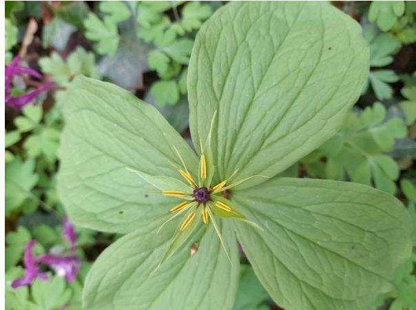
La fleur unique au centre

Le Sceau de Salomon , lui, a pris le nom du roi Salomon, sa tige feuillée quand elle fane et tombe laisse une cicatrice sur le rhizome qui ressemble à un sceau... Ses fleurs tubulaires qui pendent le long de la tige, n'étaient pas encore apparues.