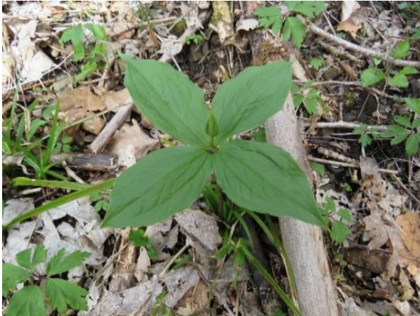
Parisette et son bouton floral

Mais selon une légende : Pâris, le héros troyen, devait offrir la pomme d'or à l'une des 3 déesses : Hera, Athéna ou Aphrodite. Pâris choisit Aphrodite qui lui promet l'amour d'Hélène, épouse de Ménélas, roi de Sparte : ce qui déclencha la guerre de Troie ! l'unique baie de la Parisette représentant la « pomme d'or ».