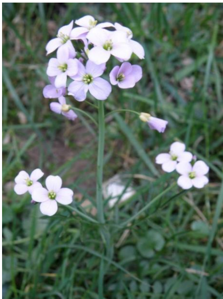
Cardamine des prés

Leurs fleurs parfumées et légèrement sucrées apaisent la toux. Autrefois, on les appelait "Coqueluchon".