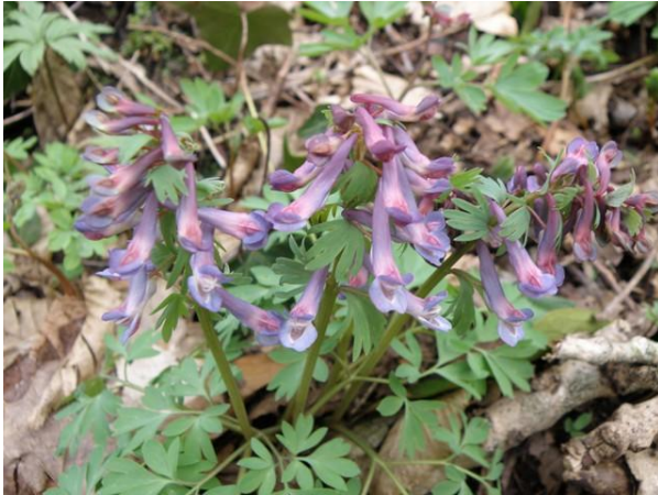
Corydalis solida (bractées digitées)