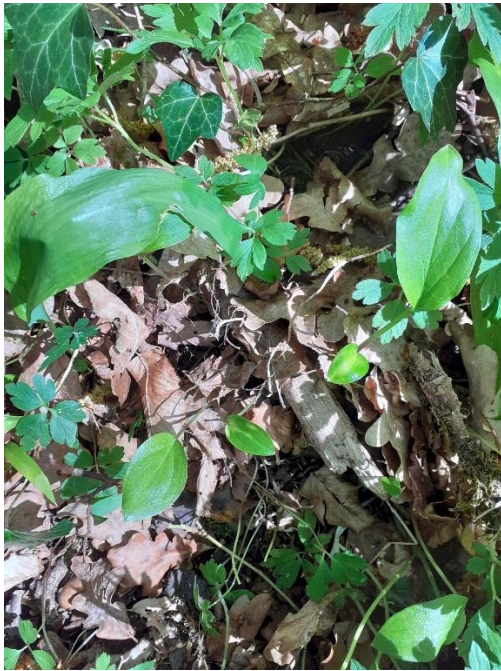
En haut, à gauche, feuille d'ail des ours A droite, jeunes feuilles d'arum

Ne pas confondre les feuilles de l'ail des ours, avec celles de l' Arum tacheté , quand elles sont jeunes (elles sont alors plus ou moins arrondies), les plus âgées se reconnaissent à leur forme : celle d'une pointe de flèche (elles sont dites « sagittées»). Parfois quelques pieds d'arum peuvent se mêler à la colonie d'ails des ours. L'arum est une plante toxique !