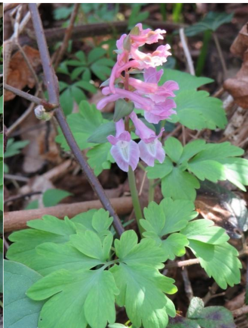
Corydalina cava (bractées simples)